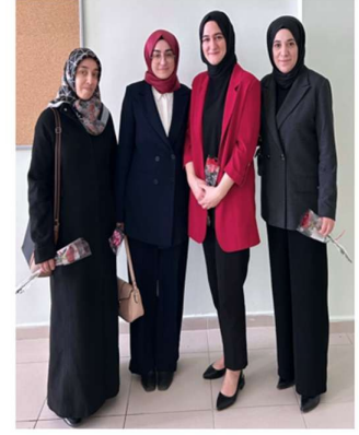
Güçlü Kadın, Güçlü Lider Paneli

Haber Linki: https://darende.ozal.edu.tr/news-detail/1041