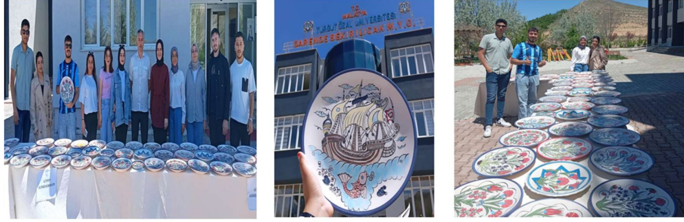
Seramiğe Nakşedilen Öğrenci Zamanı

Haber Linki: https://darende.ozal.edu.tr/news-detail/1454