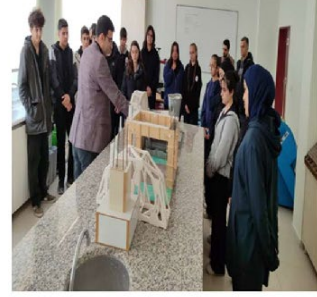
Fen Lisesi Öğrencilerinin Meslek Yüksekokulu Ziyareti

Haber Linki: https://darende.ozal.edu.tr/news-detail/1025