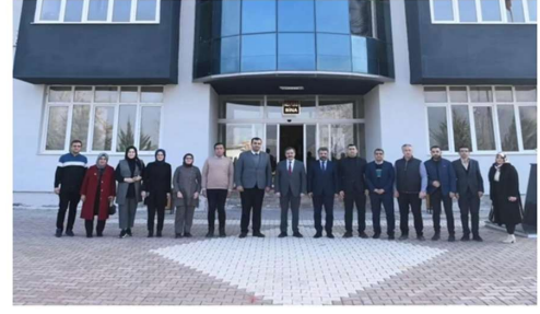
Rektörümüz ile Kahvaltı Buluşması

Haber Linki: https://darende.ozal.edu.tr/news-detail/736