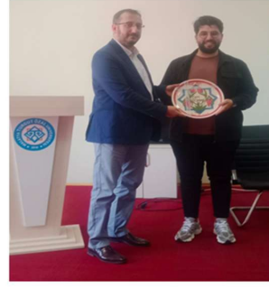
Optisyenlik Kariyer Günleri

Haber Linki: https://darende.ozal.edu.tr/news-detail/1457