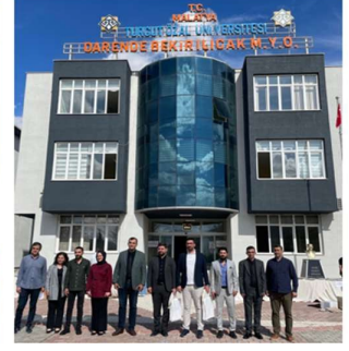
Öğrenci - Sektör Buluşması

Haber Linki: https://darende.ozal.edu.tr/news-detail/1451