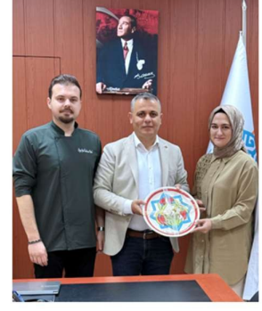
Bilimsel ve Uygulamalı Ziyaret

Haber Linki: https://darende.ozal.edu.tr/news-detail/1318