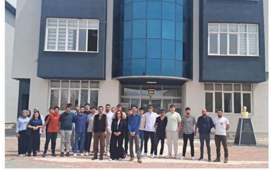
Kendine İyi Yap Semineri

Haber Linki: https://darende.ozal.edu.tr/news-detail/1371