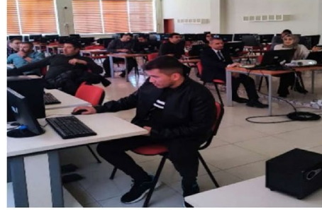
EBYS ve Resmi Yazışma Kuralları Eğitimi

Haber Linki: https://darende.ozal.edu.tr/news-detail/1015